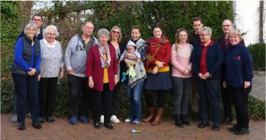
Der Gemeindegkirchenrat auf Klausur

V iele Diskussionen. Viele Prozesse. Viel Einigkeit und ebenso Uneinigkeit. Viele Menschen, die mit