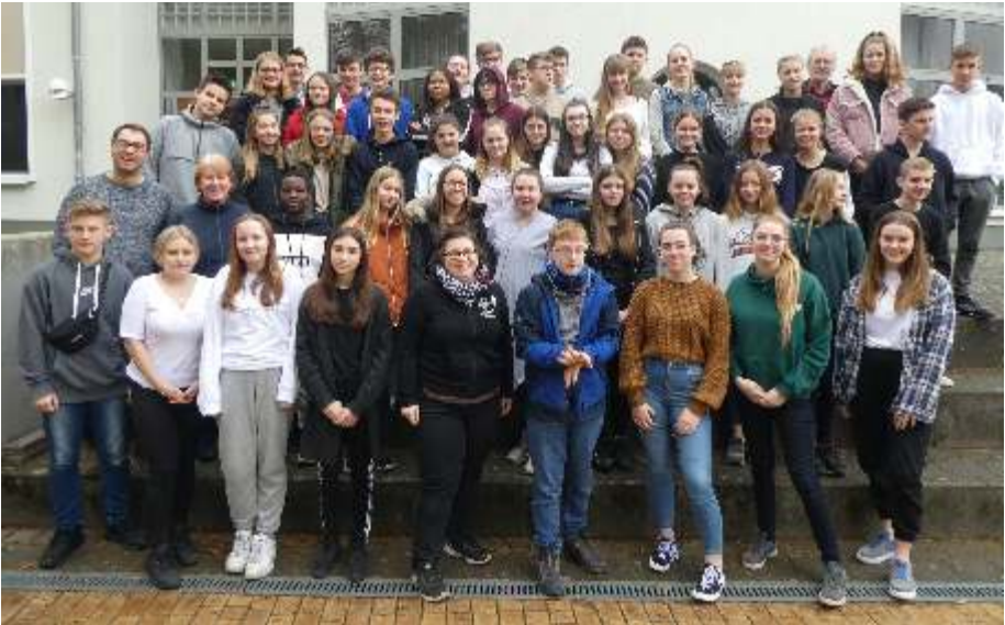
Unsere Konfirmanden auf Fahrt

an sechs Stationen die verschiedenen Aspekte unseres Abendmahls gelernt haben. So beschäftigten sie sich unter anderem mit der komplexen Symbolik der verschiedenen Aspekte des Abendmahls oder lernten die im Passahfest begründete jüdische Tradition des Abendmahls kennen. Als letzte Station durften die Konfirmanden dann ihre Ideen und Eindrücke zum christlichen Abendmahl auf Stoffstücke malen, welche zusammengenäht ein großes Abendmahlstuch ergeben, das bei ihrer Konfirmation die Kirche schmücken soll. Diesen Samstag voll von neuen Eindrücken haben wir dann abends zusammen beim gemeinsamen Feiern des Abendmahls beschlossen.