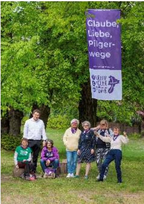
Das Pilgerteam

Eine spannende Neuerung in diesem Jahr ist die Erweiterung des Span-