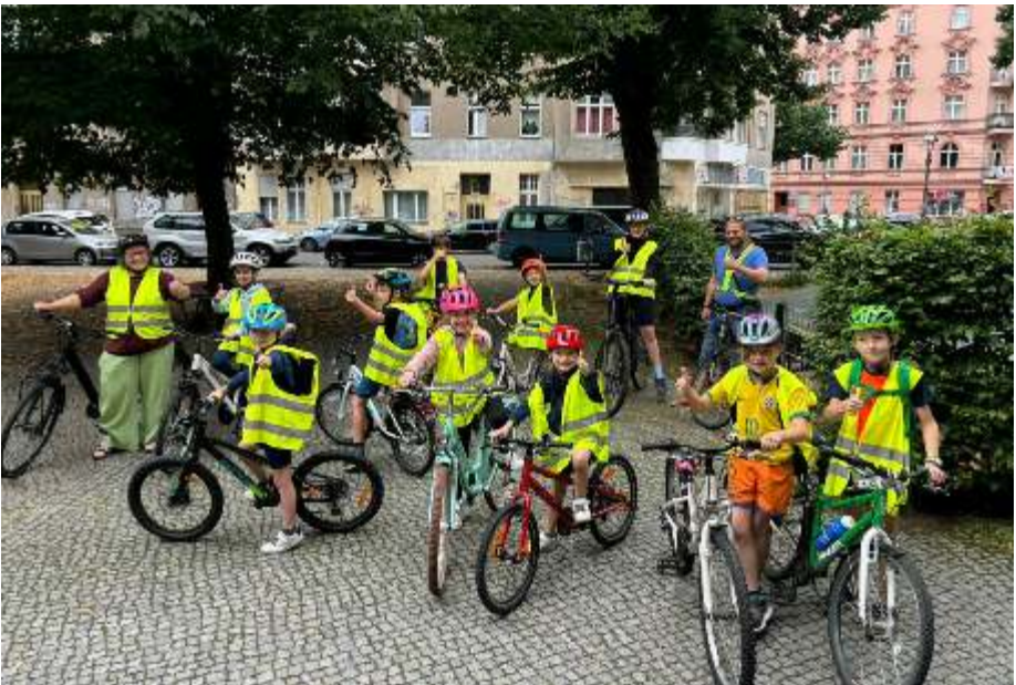
Wenn sich Kirchenmäuse auf die Räder schwingen...