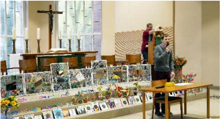
Ein buntes Programm erwartet die Kinder beim Kinderherbst

(Ein Kooperationsangebot aus Jugendhilfe, Gemeinwesen und Kirchengemeinde)