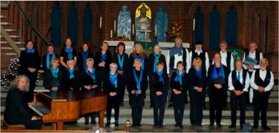
Der Gofenberg Chor erwartet Sie am 17. November in der Stiftskirche